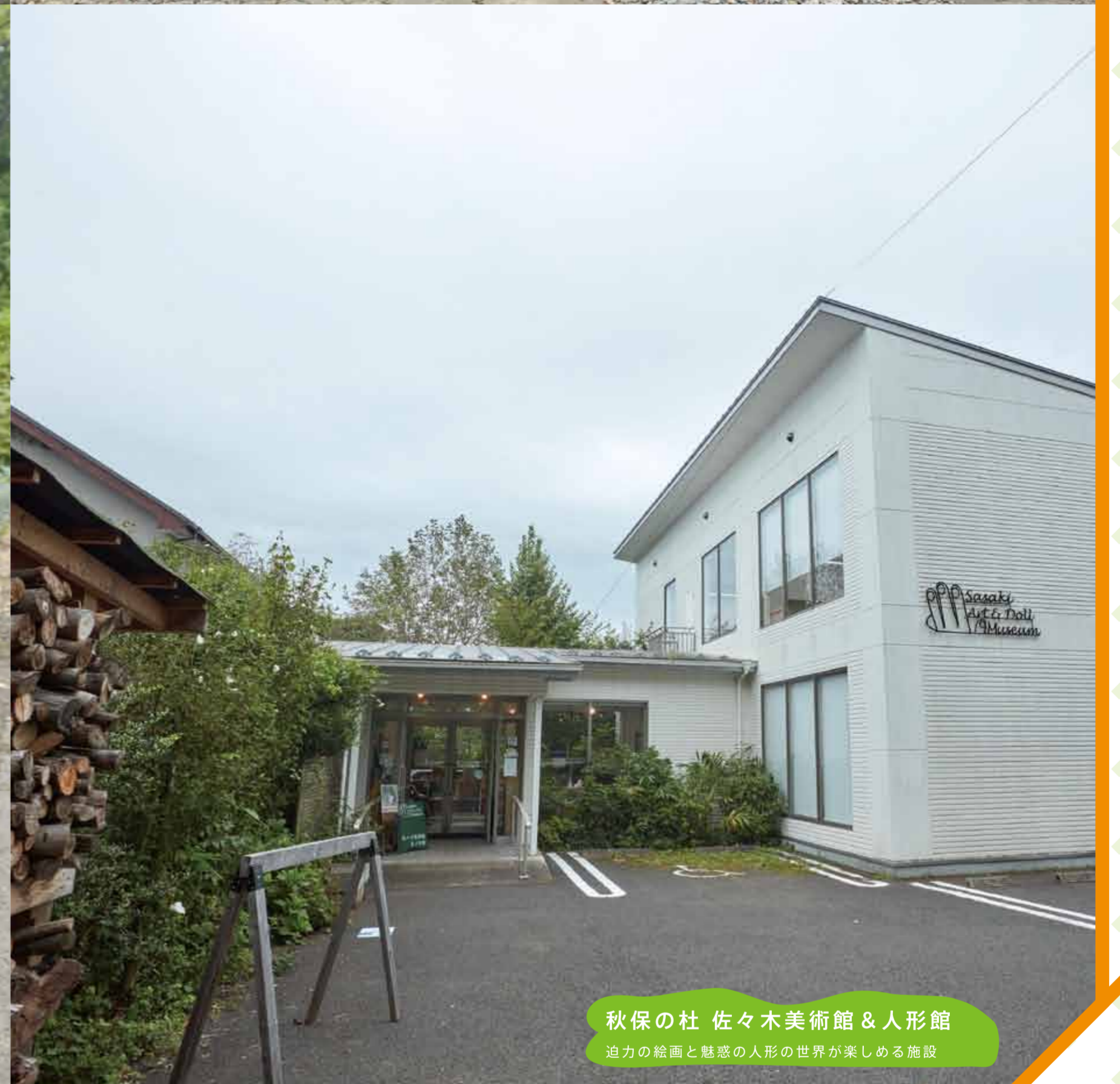
秋保の杜 佐々木美術館 & 人形館