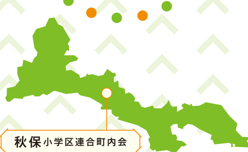
秋保小学区連合町内会

この地域には、勝負の神『秋保神社』や、 工房・カフェが点在する『石神ゆめの森』といったスポットがあります。 年々高齢化が進んでいる地域ですが、若い者に負けるか！ という気概で『さかいの産直市』や獣害対策・ ゴミのポイ捨て防止のための『イノシシ柵』の設置など、 様々な活動に取り組んでいます。