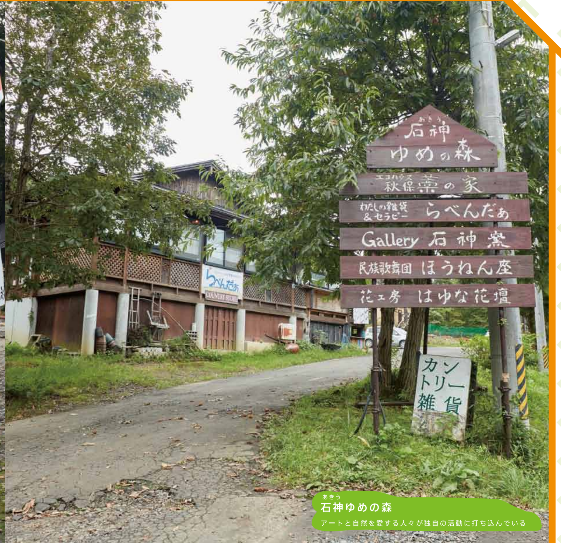
あきう 石神ゆめの森