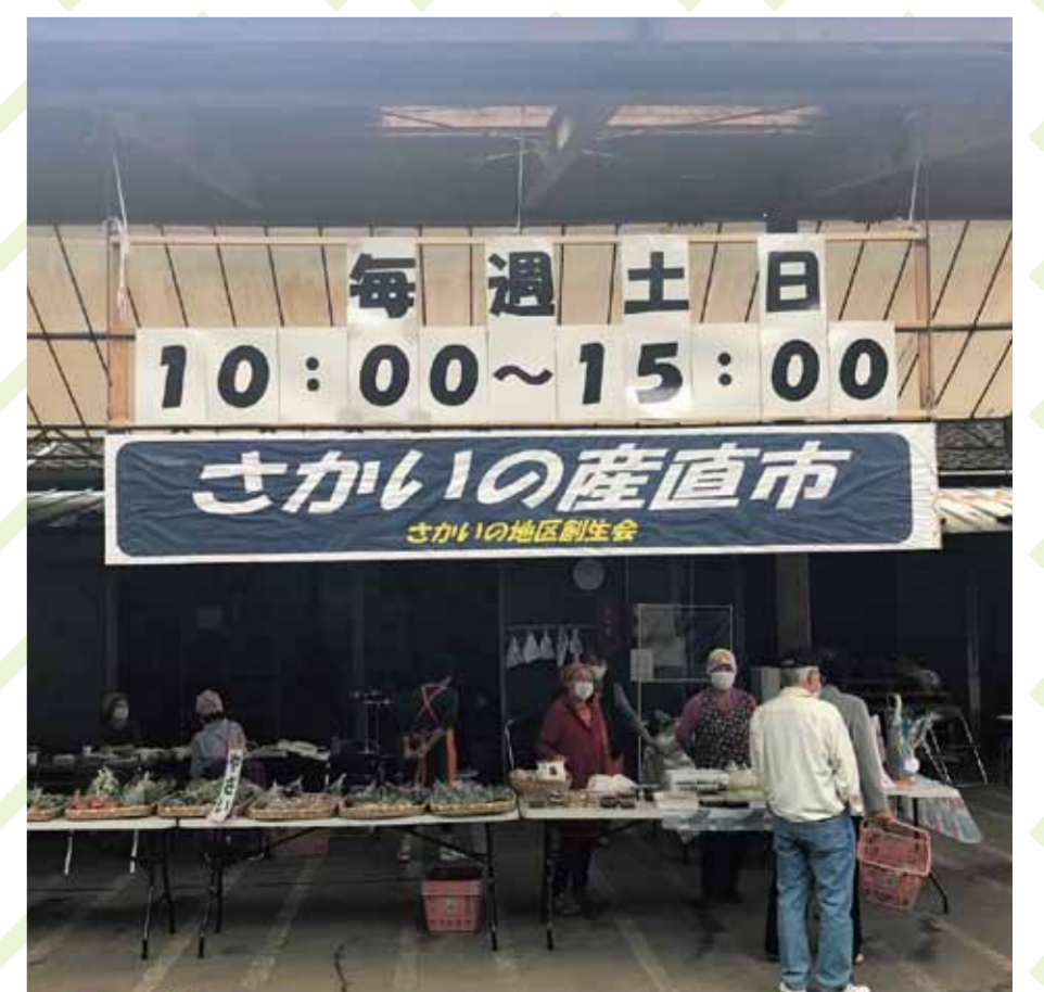
さかいの産直市: 地元農家が育てた新鮮な農作物を購入できる市場

この地域には、勝負の神『秋保神社』や、 工房・カフェが点在する『石神ゆめの森』といったスポットがあります。 年々高齢化が進んでいる地域ですが、若い者に負けるか！ という気概で『さかいの産直市』や獣害対策・ ゴミのポイ捨て防止のための『イノシシ柵』の設置など、 様々な活動に取り組んでいます。