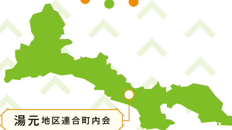
湯元地区連合町内会