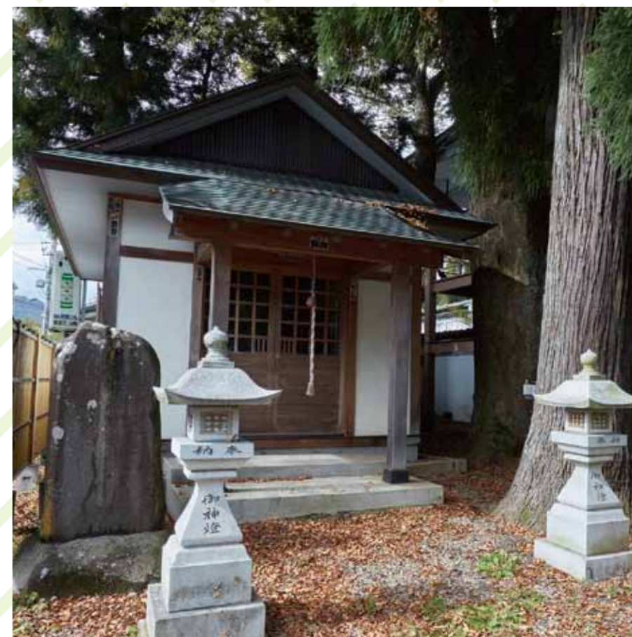
湯神社：秋保温泉の守護神として鎮座している神社