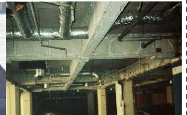
鉄骨を被覆して保護 石綿含有耐火被覆材