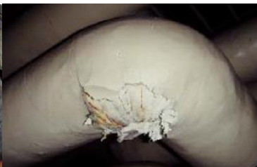
エルボ部に使用 石綿含有保温材