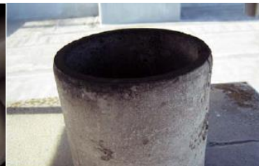
煙突の内側に使用 石綿含有断熱材