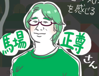
デザイン・クリエイティブセンター神戸 【KIITO】センター長