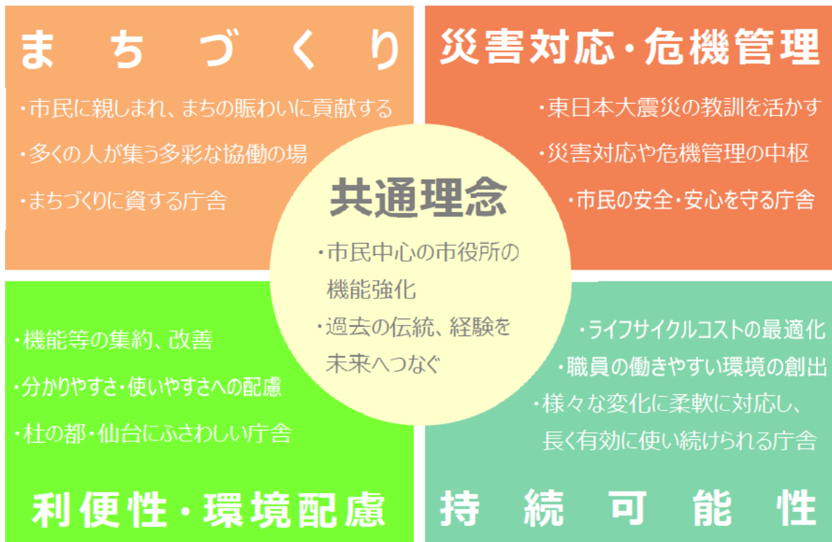
【新本庁舎のコンセプトイメージ図】

最適なライフサイクルコストの下、業務の質や効率性の向上に寄与するような職員の働きやすい環境を創出するとともに、様々な変化にも柔軟に対応し、長く有効に使い続けられる庁舎を目指します