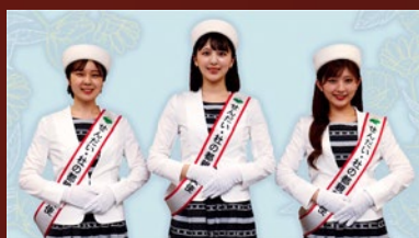
せんだい・杜の都 親善大使

各地での観光プロモーション事業や交流行事への参加を通じて、仙台市の魅力を発信するPRパースン「せんだい・杜の都親善大使」と、山形を代表する夏祭り「やまがた花笠まつり」に花を添え、「花笠踊り」を通じて山形の魅力を発信する「ミス花笠」が、皆様の旅のお供を務めます。