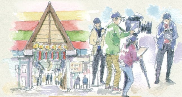
映画のロケに遭遇するかも?!