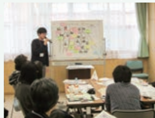
探検の成果を発表します。