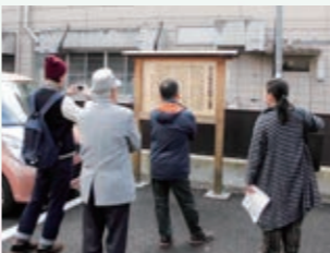
若林の各地域を探検しました。

地域を愛する若林区民が、東北工業大学の学生と一緒にまちを歩き、取材をして作り上げた「まち歩きマップ」です。地域の魅力がたっぷり詰まった「若林WALKER」を片手に、あなたもまちを探検してみませんか？