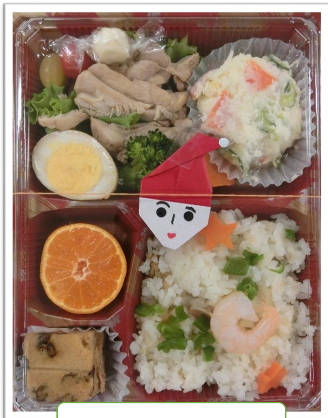
この日のあかね弁当