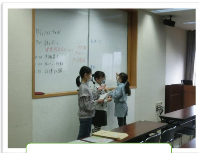
進行や記録もメンバーが行います！

後半の活動は毎月恒例の手紙書きでした。今回は12月24日のお弁当に添える手紙だったので、クリスマスや冬、お正月などに関する内容が多かったです。また、寒い季節のため「風邪をひかないように気を付けてください」や「雪道は滑りやすいので気を付けてください」など、思いやりある内容の手紙がたくさんありました。