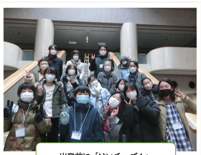
出発前に「はいチーズ！」