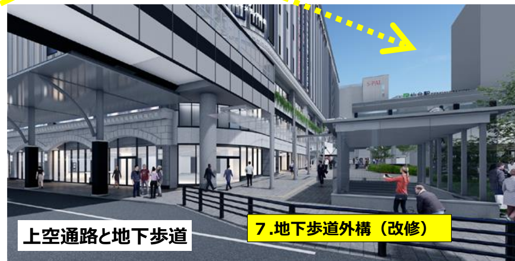
上空通路と地下歩道