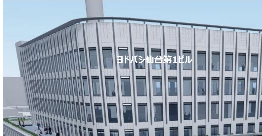
ヨドバシ仙台第1ビル