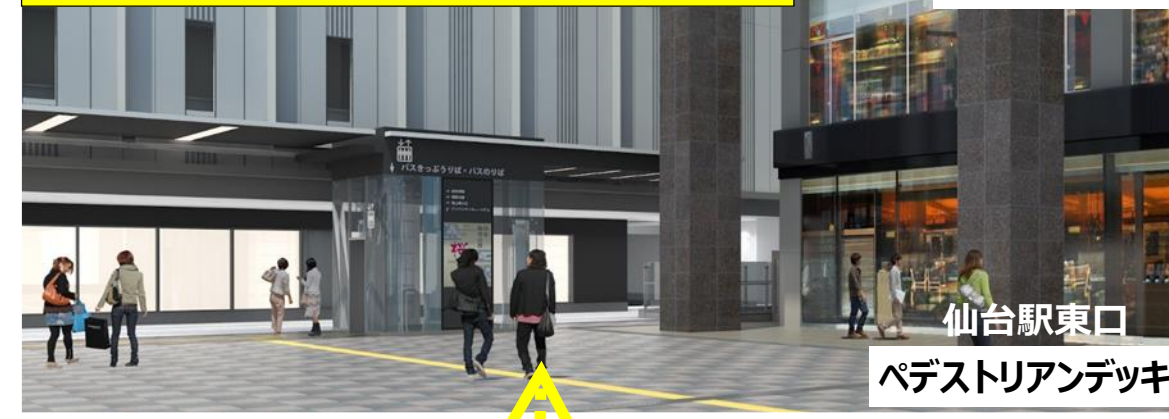
仙台駅東口 ペDESTリアンデッキ