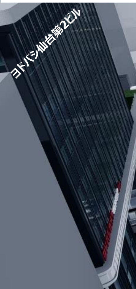
ヨドバシ仙台第2ビル