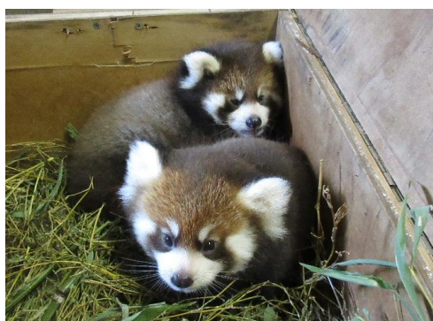
レッサーパンダ(グミ・アケビ)