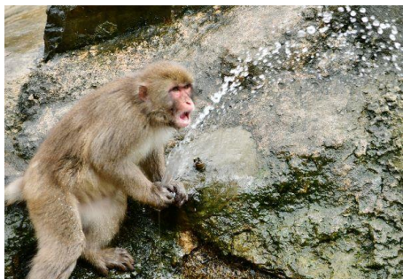
「暑さをふっとばせ〜」